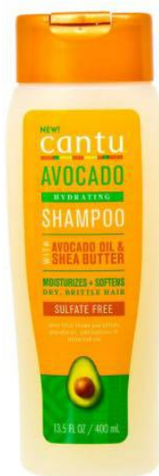
Cantu Avocado Sulfate Free Shampoo

Suosittellemme Final Wash -pesuun valikoimastamme esimerkiksi näitä tuotteita: