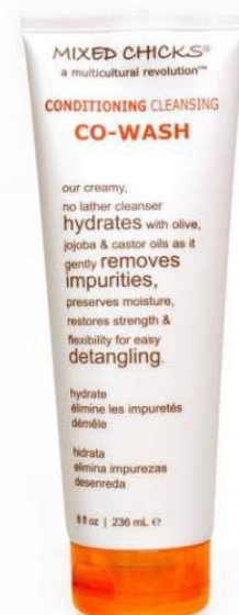
Mixed Chicks Co-Wash