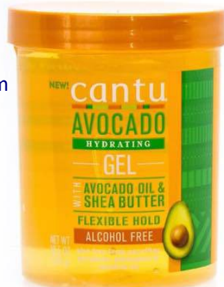
Cantu Avocado Hydrating Gel