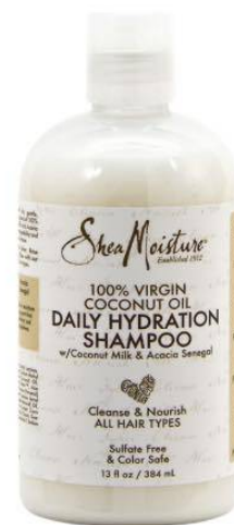
Shea Moisture Coconut Shampoo