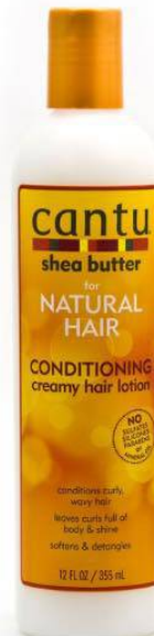
Cantu Conditioning Creamy Hair Lotion