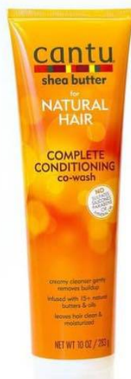
Cantu Natural Hair Conditioning Co-Wash