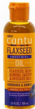
Cantu Flaxseed Smoothing Oil