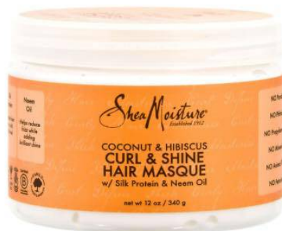
Shea Moisture Curl & Shine Hair Masque