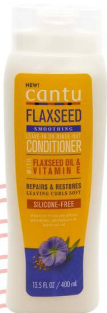
Cantu Flaxseed Silicone Free Conditioner

Suosittellemme hoitaineksi valikoimastamme esimerkiksi näitä tuotteita: