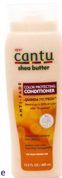
Cantu Color Protecting Conditioner