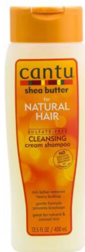
Cantu Natural Cleansing Cream Shampoo